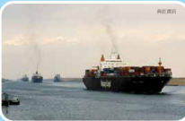
▲歐、亞洲間的貨物，大多需經由蘇伊士運河運送。平均每年大約有兩萬多艘船隻通過蘇伊士運河。

蘇伊士運河位在埃及西奈半島的西側，是目前往來歐洲和亞洲最短的水路；在古代，船隻如果來往歐、亞，通常要沿著非洲大陸，繞過南非的好望角才能抵達；自從蘇伊士運河開通之後，船隻可以直接穿越西奈半島，大大縮短航行距離。